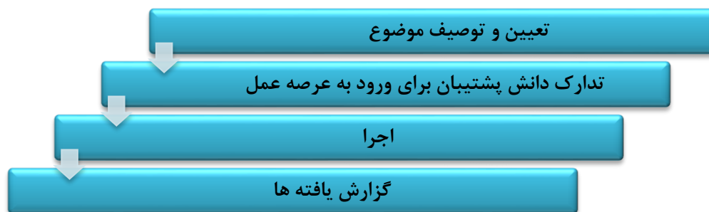
شکل شماره ۲: چرخه درس آموزش پژوهی در عرصه عمل

درس آموزش پژوهی در عرصه عمل در دوره مهارت آموزی به ۲ مرحله تقسیم می شود. بر این اساس مرحله اول شامل «تعیین و توصیف موضوع» و «تدارک دانش پشتیبان برای ورود به عرصه عمل» و مرحله دوم شامل «اجرا» و «گزارش یافته ها» تقسیم می شود. شرح فعالیت های مهارت آموز در هر یک از مراحل فوق، در بند ۵ همین فصل (کاربرگ های ارزشیابی درس آموزش پژوهی) بیان شده است.