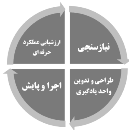
شکل شماره ۴: چرخه فعالیت کارآموزی

این فرایند شامل چهار مرحله است که عبارتند از: «نیازسنجی»، «طراحی و تدوین واحدهای یادگیری»، «اجرا و پایش» و «ارزشیابی عملکرد حرفه ای». شکل شماره ۴، چرخه فرایند کارآموزی را نشان می دهد: